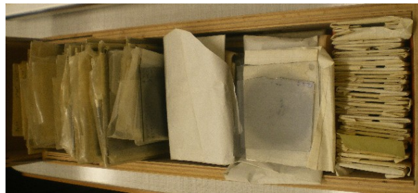
Photoplaten vom Bamberger Schmidtteleskop