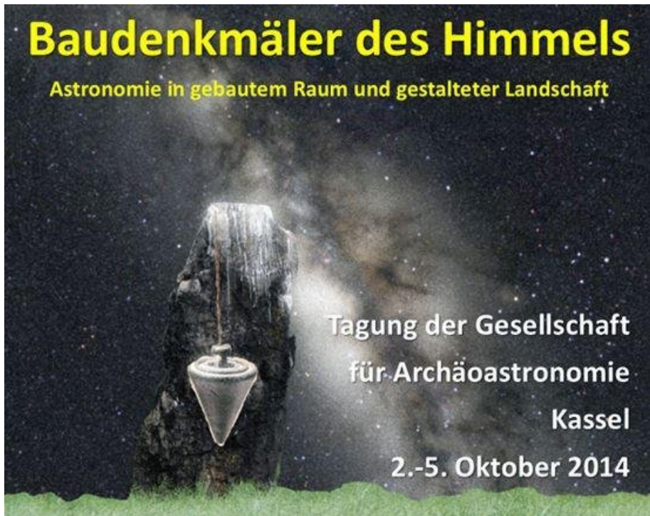
Abbildung 0.1: Baudenkmäler des Himmels – Astronomie in gebaurem Raum und gestalteter Landschaft – Tagung der Gesellschaft für Archäoastronomie in Kassel (2014)