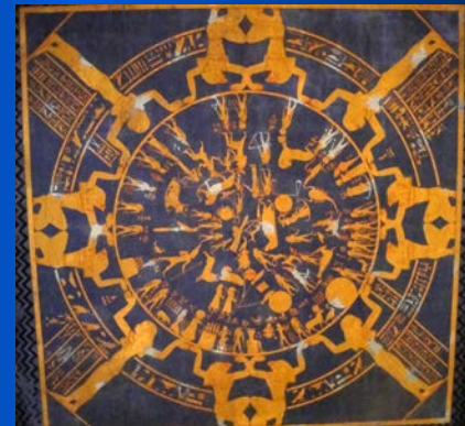
Tierkreis von Dendera, Hathor-Tempel, 25 v.Chr.

Astronomie und Vermessungstechnik waren hoch entwickelt im alten Ägypten. Beim Bau von Pyramiden und Tempeln erfolgte eine genaue Orientierung nach den Himmelsrichtungen. Besonders eindrucksvoll ist Abu Simbel; der Tempel ist so orientiert, dass jeweils am 21. Oktober und 21. Februar beim sog. Sonnenwunder die Strahlen der aufgehenden Sonne die Statuen des Ptah, Amun-Re, Ramses II. und Re-Harachte weit hinten im Tempel für etwa 20 Minuten beleuchten. Kosmologisch von Interesse sind die drei Schöpfungsmythen von Hermopolis, Heliopolis und Memphis. Zur Zeitmessung bei Tag und Nacht dienten vielfältige Instrumente wie Wasser-, Sonnen- und Sternuhren. Das Ägyptische Jahr teilte man in drei Jahreszeiten mit je 4 Monaten zu 30 Tagen ein, plus 5 Zusatztage. Den Neujahrstag markierte der Frühaufgang des Sothis (Sirius), der mit der Nil-Überschwemmung zusammenfiel. Auf Vorschlag des Astronomen Sosigenes von Alexandria wurde mit dem Dekret von Canopus (238 v.Chr.) das Alexandrinische Jahr eingeführt mit einem Schalttag alle 4 Jahre. Diese Idee übernahm Caesar 45 v.Chr. und ist als Julianisches Jahr bekannt. Der Sonnenkult hatte große Bedeutung; es gab den Sonnengott Re in diversen Gestalten: Horus, Skarabäus, Himmelskuh Hathor, Osiris. Während der Amarna-Zeit, 1363-1346 v.Chr., gab es unter Amenophis IV. Echnaton eine monotheistische Religion mit dem Sonnengott Aton als einzige Gottheit.