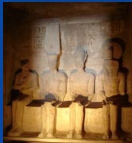
Sonnenwunder von Abu Simbel