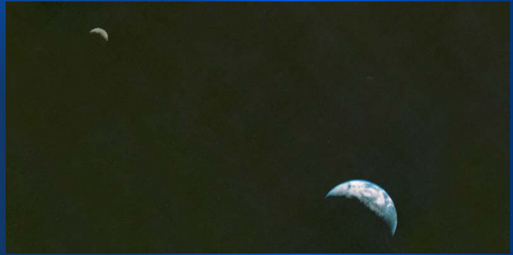
Diese "Ikone" einer Fotografie von Voyager 1 zeigt erstmalig Mond und Erde gemeinsam

In den 1960er Jahren starteten die ersten unbemannten Raumsonden zu den relativ erdnahen Gesteinsplaneten Venus, Mars und Merkur. Eine Reise zu den Gas-Giganten des äußeren Sonnensystems - Jupiter, Saturn, Uranus und Neptun - stellte Wissenschaftler und Techniker nicht zuletzt aufgrund der weitaus größeren Entfernungen vor eine ungleich schwierigere Aufgabe. Visionäre Wissenschaftler entdeckten dann, dass sich in der zweiten Hälfte der 1970er Jahre eine einmalige Gelegenheit zur "Grand Tour" in die weitgehend unbekannte Welt jenseits des Mars bot. Nur alle 176 Jahre gibt es ein kurzes Zeitfenster, in dem die Planetenkonstellation für ein solches Unternehmen optimal ist. Dabei würde die Gravitation der Planeten genutzt, um die Raumsonden auf ihrer Reise zu beschleunigen. Der allgemeinverständliche Vortrag erzählt davon, wie diese Vision gegen viele Widerstände in die Realität umgesetzt wurde. Die Raumsonden Voyager 1 und Voyager 2 revolutionierten unser Bild des Sonnensystems und faszinierten durch Bilder fremdartiger Welten. Aber die Missionen sind noch lange nicht zu Ende: Auf ihrer Reise zu den Sternen werden beide Raumsonden noch für viele Jahre Daten zur Erde senden. Vielleicht werden Sie auch in unvorstellbar fernen Zeiten einer außerirdischen Zivilisation Botschaften, Bilder und Töne unserer längst vergangenen Welt übermitteln.