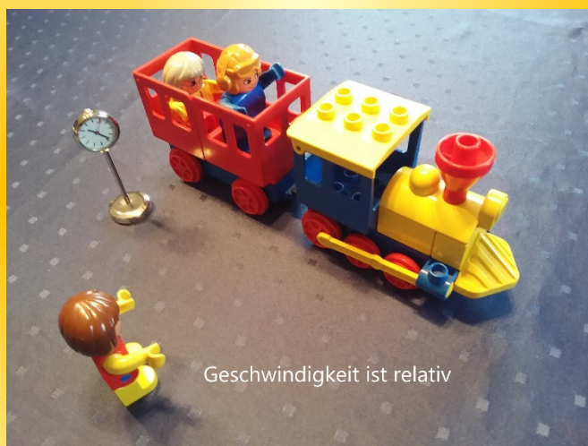
Geschwindigkeit ist relativ

In der Antike stellte man sich die Frage, ob das Licht unendlich schnell sei oder nicht. Jahrhunderte später begann mit Galilei die Zeit, in der man ernsthaft die Geschwindigkeit zu messen begann. Römer, Fizeau u.a. näherten sich dem Wert von c mittels direkter Messmethoden, bis beim Doppelspaltexperiment von Young die Frage nach der Natur des Lichtes aufkam: Teilchen oder Welle? Unter Nutzung des Wellenmodells stießen Michelson und Morley auf die Konstanz der Lichtgeschwindigkeit, die Einstein in seiner speziellen Relativitätstheorie zu erklären vermochte. Und schließlich muss noch Maxwell erwähnt werden, der das (sichtbare) Licht einbettete in die Gesamtheit der elektromagnetischen Wellen.