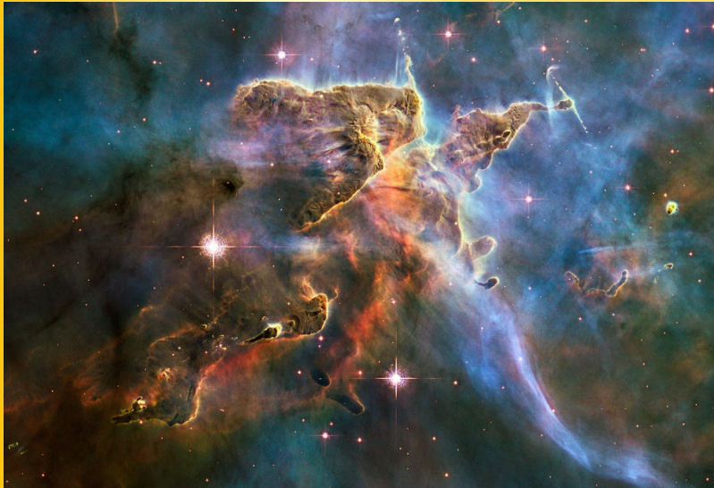
Carina Nebel, ein aktives Sternentstehungsgebiet in unser Milchstraße

Das Ökosystem von Galaxien: Wie Sterne entstehen und vergehen