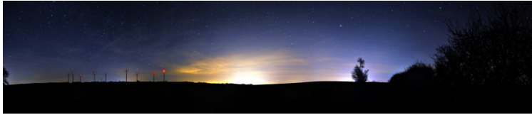
Lichtverschmutzung: Lichtglocke über Jena (2010)

Zum Unesco internationalen Jahr des Lichts