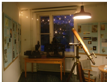
Ausstellung „Weltbild im Wandel“

„Sterne über Hamburg“, Poster-Ausstellung im Hauptgebäude