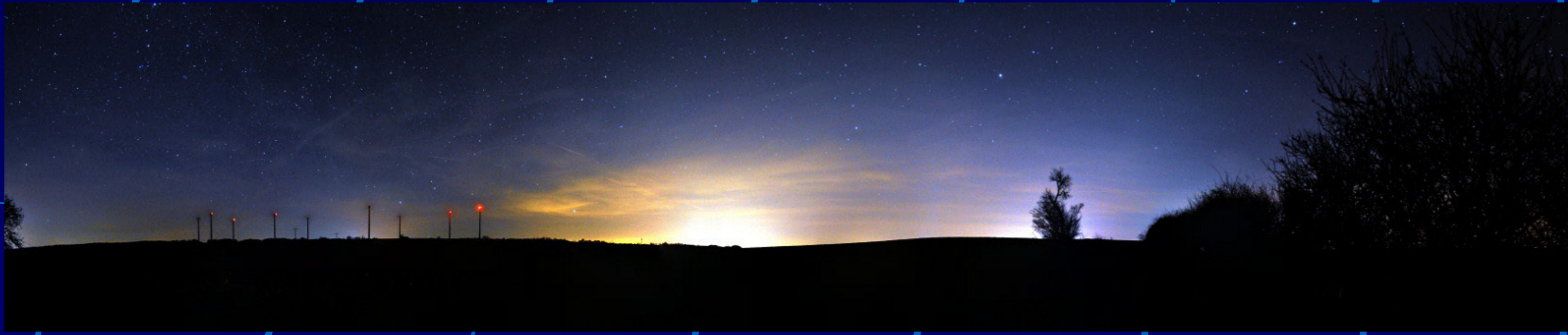
Lichtverschmutzung: Lichtglocke über Jena (2010)

Motto: „Mehr Licht“ Zum Unesco internationalen Jahr des Lichts