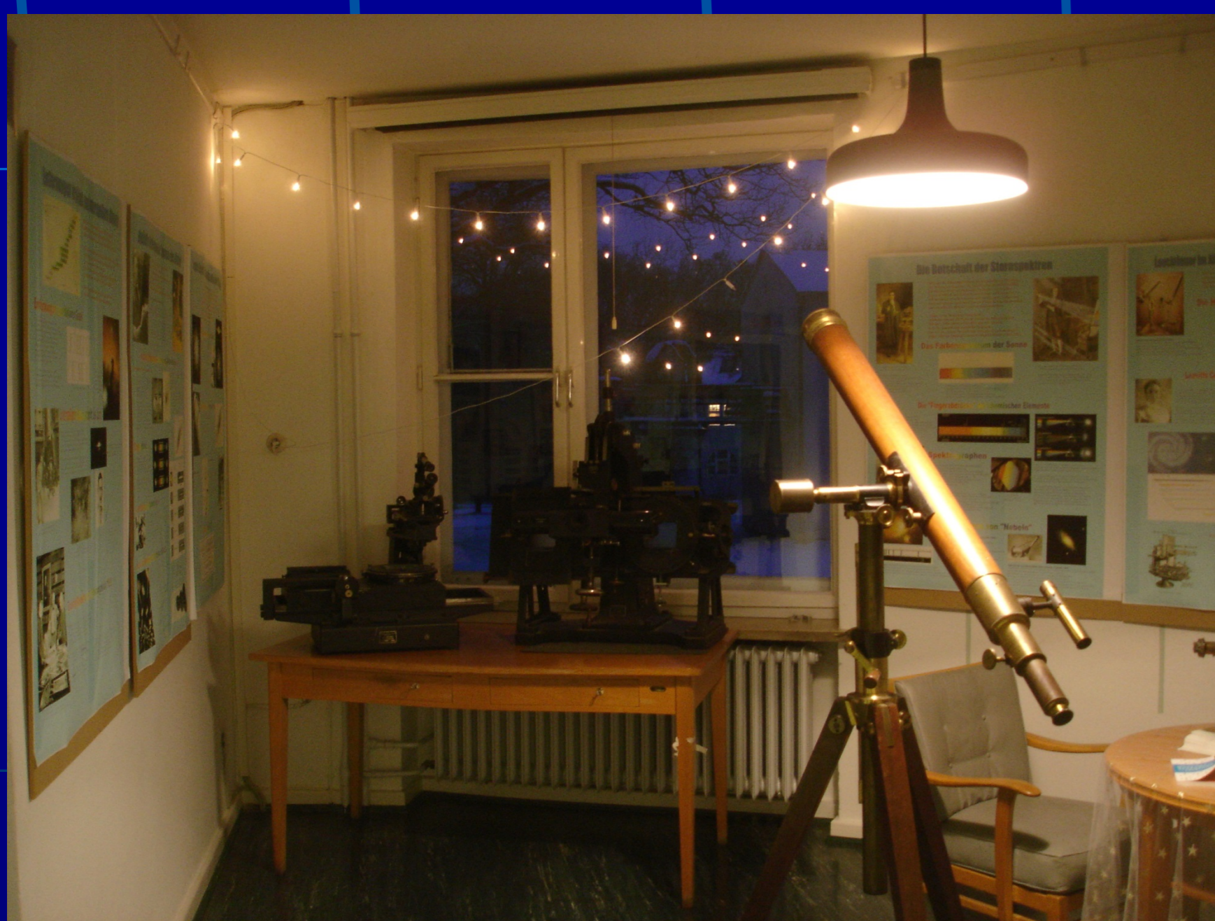
Ausstellung „Weltbild im Wandel“

„Sterne über Hamburg“, Poster-Ausstellung im Hauptgebäude