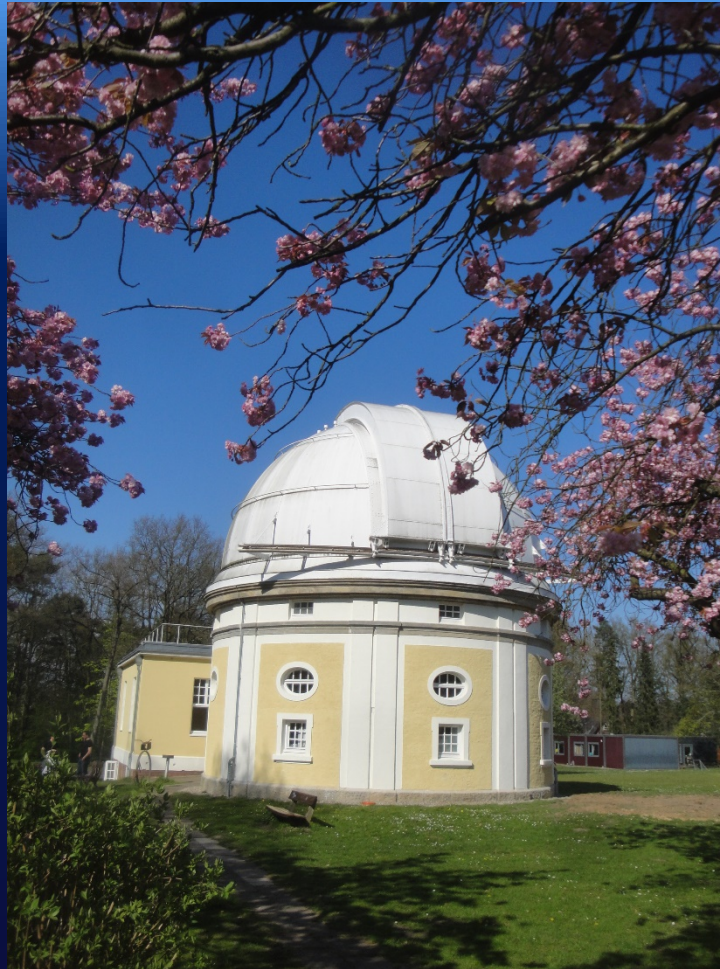
1m-Spiegelteleskop-Gebäude der Hamburger Sternwarte in Bergedorf, FHS: Sanierung 2008-2010, Restaurierung 1m-Spiegelteleskop (2011/12)

Für sein Engagement, besonders bzgl. der Sanierungsarbeiten, wurde der Förderverein 2006 mit dem Deutschen National-Preis für Denkmalschutz ausgezeichnet. 2008 wurde die Sternwarte als Kulturdenkmal von nationaler Bedeutung eingestuft.