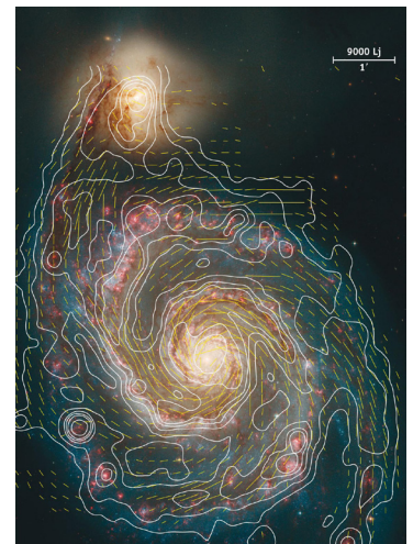
Rechts unten: Magnetfeldstruktur der Whirlpool Galaxie