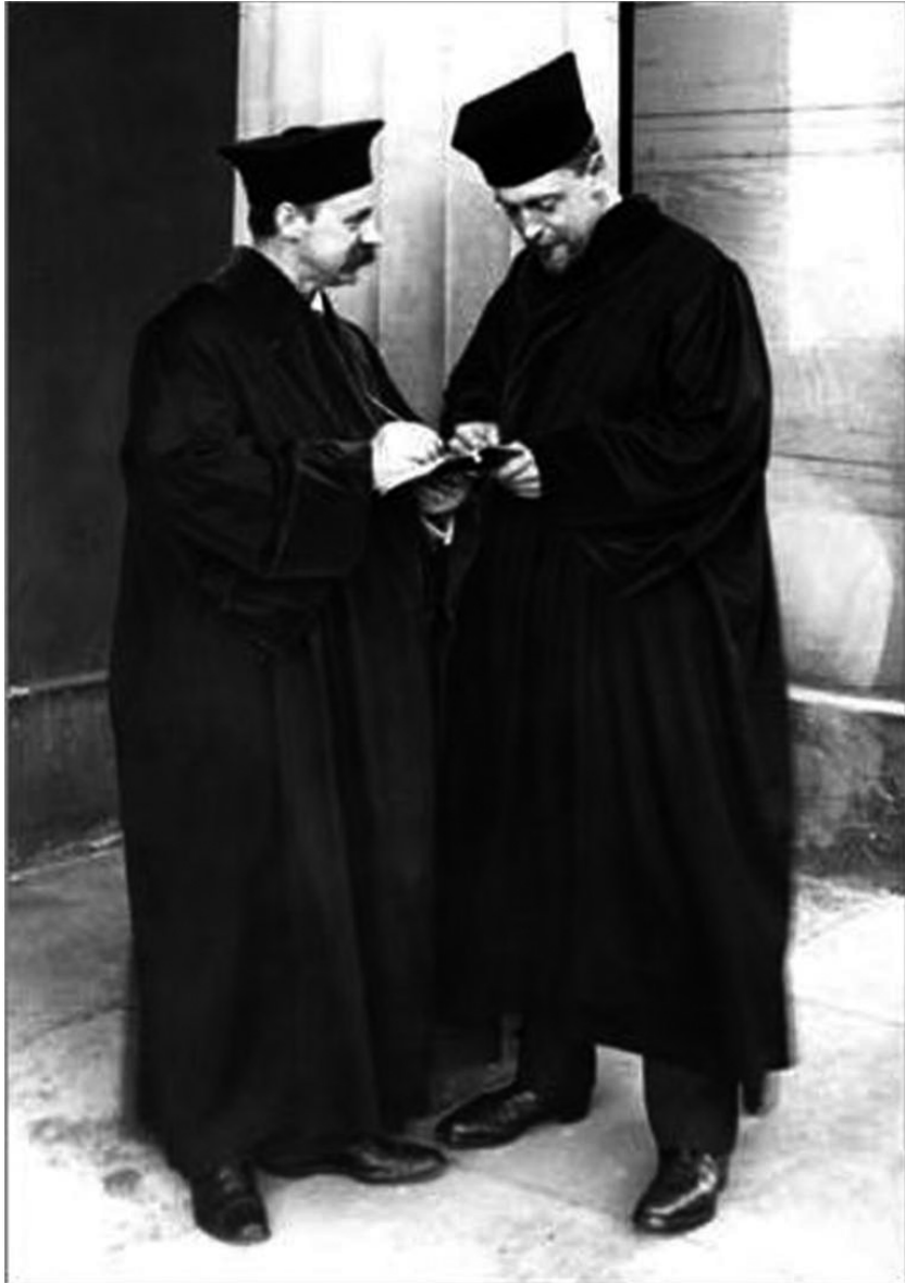
Abbildung 0.1: Karl Schwarzschild & Ejnar Hertzsprung