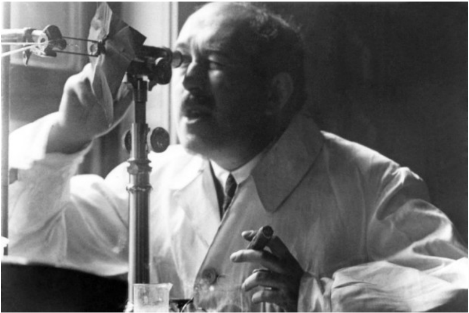
Abbildung 0.1: Otto Stern (1888–1969) im Labor in der Physikalischen Chemie in der Hamburger Universität Fachbereich Chemie