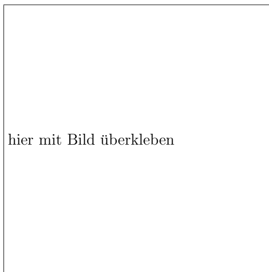
Abbildung 3: Lichtenbergsche Figur