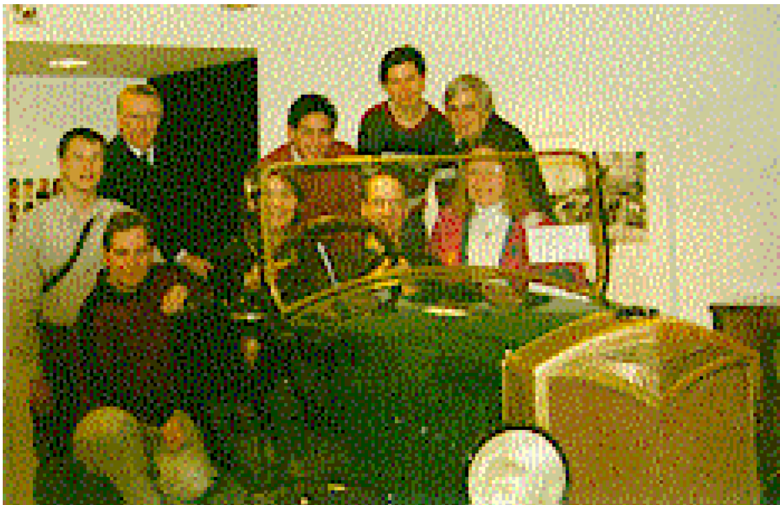
Abbildung 4: Die Exkursionsteilnehmer im Siemensmuseum München