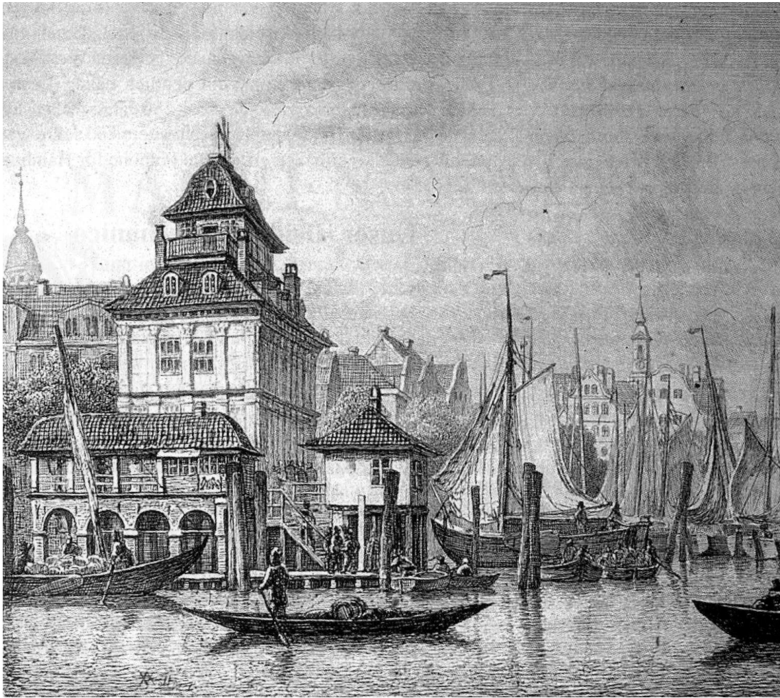
Abbildung 0.1: Johann Beyers Steernenkikerhuus am Baumwall, 1721 Hamburger Sternwarte